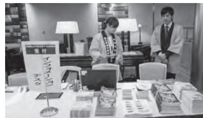
インフォメーションデスクもあります