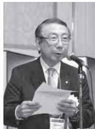
大谷全間連会長 挨拶