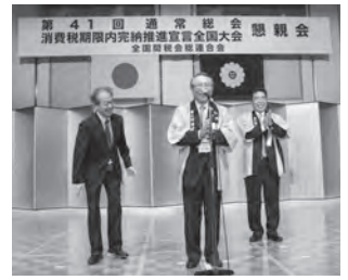
博多手一本による本締め