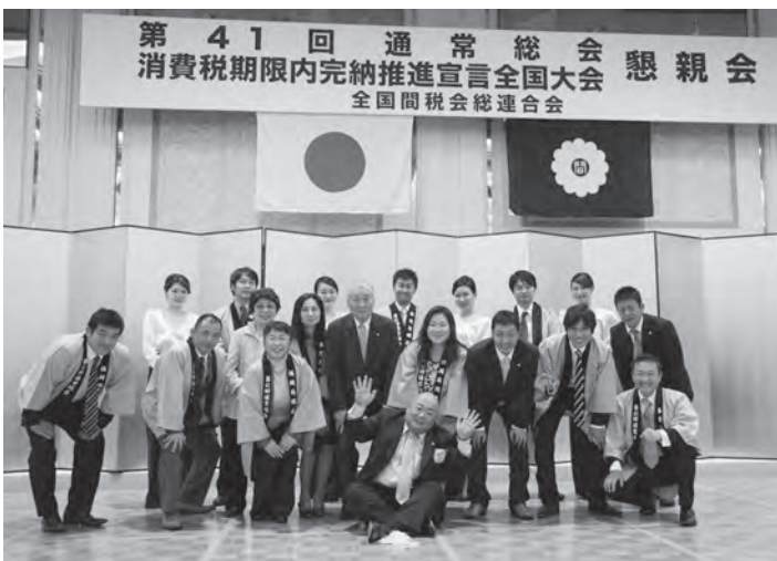
頑張りました 西福岡間税会