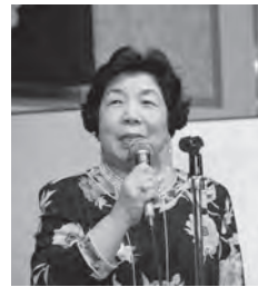
中締め 深町福局間連副会長