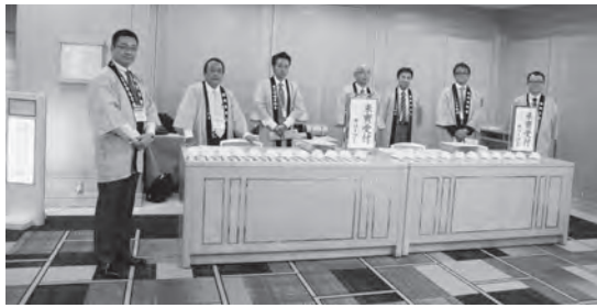
来賓受付オールキャスト