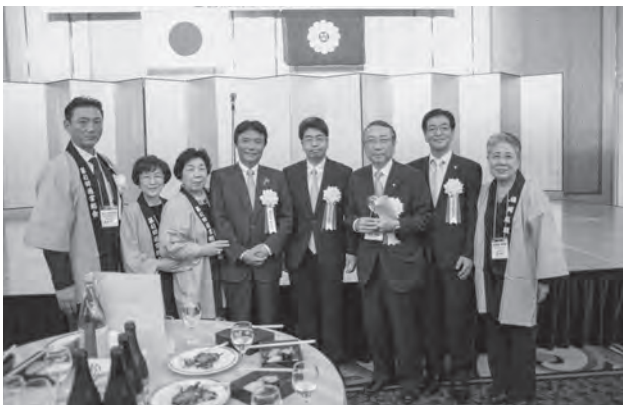
ご来賓の皆様と一枚パチリ