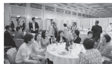
反省会は盛大 かつさやかに