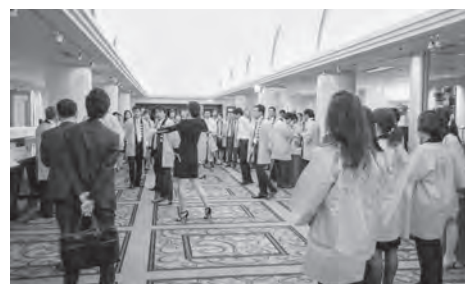
ピンクのハッピー大集合