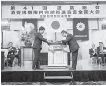
消費税期限内完納推進宣言