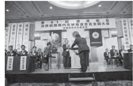
組織増強功労者表彰