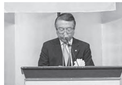
大谷全間連会長挨拶