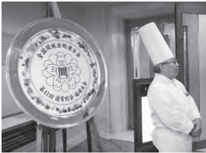
総料理長も笑顔でお出迎え