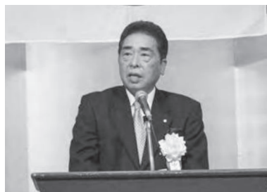
開会の辞 中川原福局間連会長