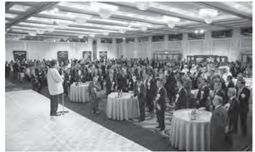
懇親会いよいよ開宴