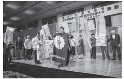
会旗の引継ぎ (福局間連→東海間連)