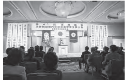
記念講演 神田紅独演会